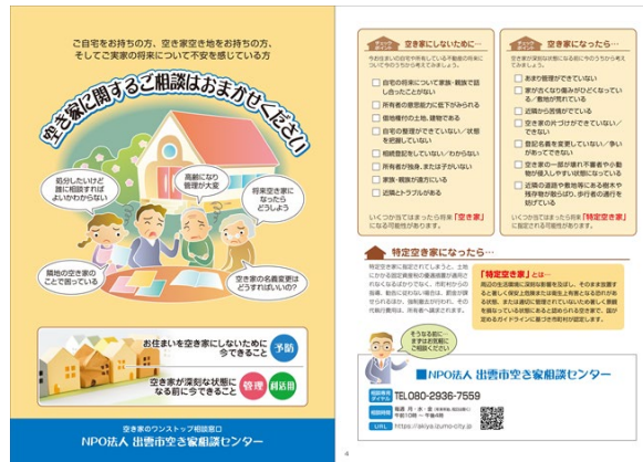
啓発パンフレットの作成・配布 地域住民および関係窓口に配布

■センター設立と地域活動拠点の整備を同時進行 NPO法人を設立し、空き家所有者の抱える問題解決や活用方法についての総合的な相談センターとして『出雲市空き家相談センター』を整備すると同時に、市内の各地区の実情に合わせた地域活動拠点整備実施（現在2拠点、目標43拠点）